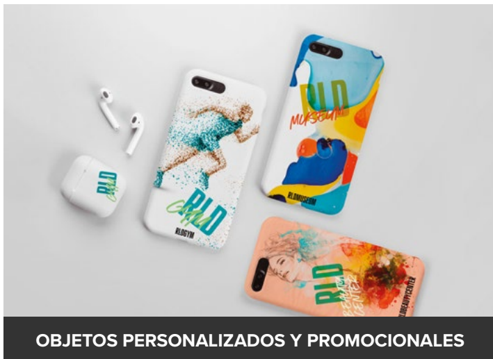
OBJETOS PERSONALIZADOS Y PROMOCIONALES