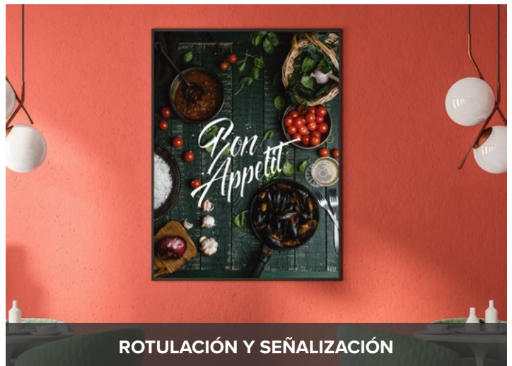
ROTULACIÓN Y SEÑALIZACIÓN