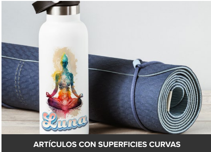
ARTÍCULOS CON SUPERFICIES CURVAS