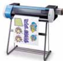
Soporte opcional PNS-24

Acercas de la tinta Metalic Silver Debido a la naturaleza de la tinta metálica, sus pigmentos se depositan en el cartucho y en el sistema de flujo de la tinta, con lo cual es necesario agitar el cartucho antes de cada uso. La duración en exteriores es de tres años para las tintas CMYK, y de entre uno y tres años para la tinta metálica, según el material utilizado. Roland recomienda encarecidamente realizar una laminación para los gráficos tanto de interiores como de exteriores, con el fin de asegurar la calidad de la tinta metálica.